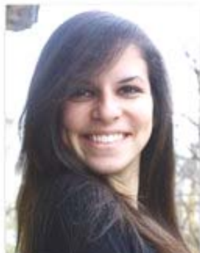
Антония XI д