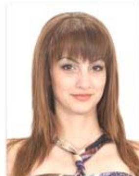
Елена XI в