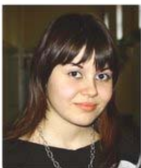
Кристин XI г

Вратите са отворени за всеки, който може да ни изненада с нещо интересно или просто му е любопитно. Последната страница сме си я отделили специално за нас. Тук ще ни видите кои сме.