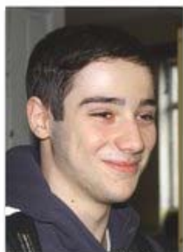
Никола IX д