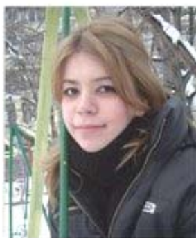
Вержиния XI б