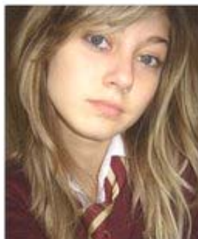
Ивелина XI г