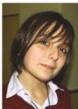
Нора IX д